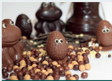
Chocolats de Pâques