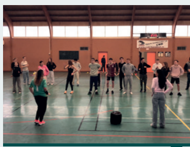
IMPRO, invité dans un lycée de Honfleur